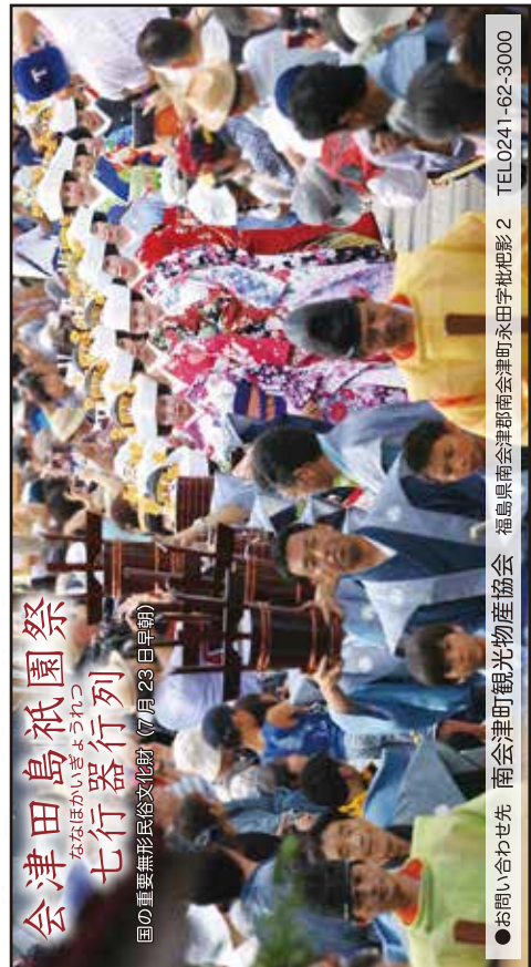
会津田島祇園祭 七行装行列 国の重要無形民俗文化財(7月23日奉納)

檜枝岐歌舞伎 おでかけ前に、まずコチラ。目的地の情報満載！ 観光・歴史・自然・食・お土産・イベントなど http://wowmap.jp