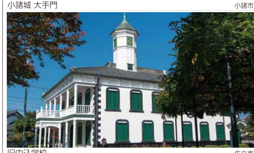
小諸城 大手門 小諸市 旧中込学校 佐久市 おでかけ前にまずコナラ。目的地の情報満載! 観光・歴史・自然・宿泊・グルメ・レジャー・カルチャーイベントなど 英公社株式会社 http://wowmap.jp わおマップ 検索