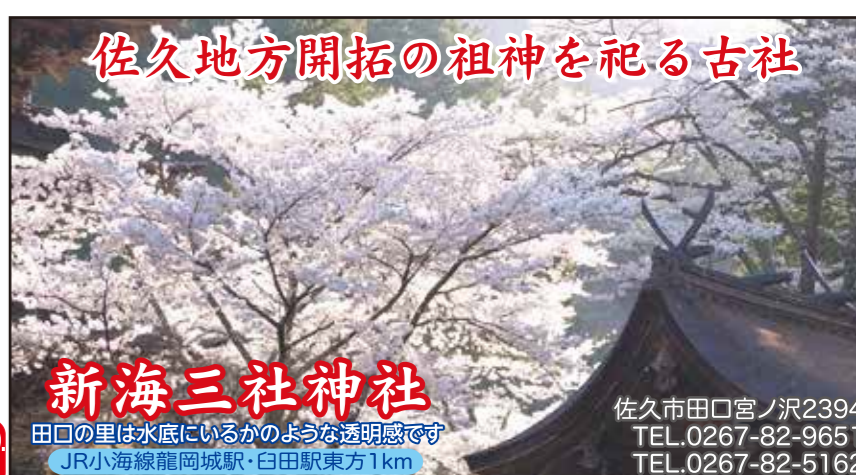
佐久地方開拓の祖神を祀る古社 新海三社神社 田口の里は水蔵にあるふたつのお稲荷さま 田口町 日本正社 佐久市田口町ノ沢2394 TEL.0267-82-9651 TEL.0267-82-5102