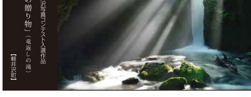
「天からの贈り物」(お返し)の滝 平成29年長野県「お返し」の滝 平成29年長野県「お返し」の滝