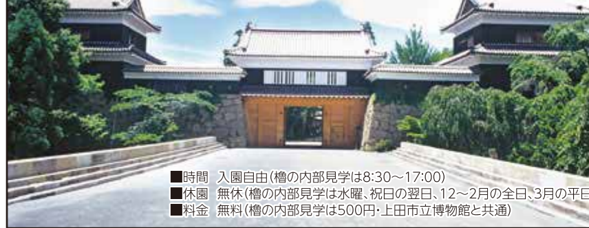
上田城跡公園 上田市 上田城跡公園は、上田藩の中心地であった上田城跡に、上田城跡公園として整備されています。現在は公園として整備されており、桜や紅葉などの名所として有名です。上田駅から徒歩12分。【上田市】