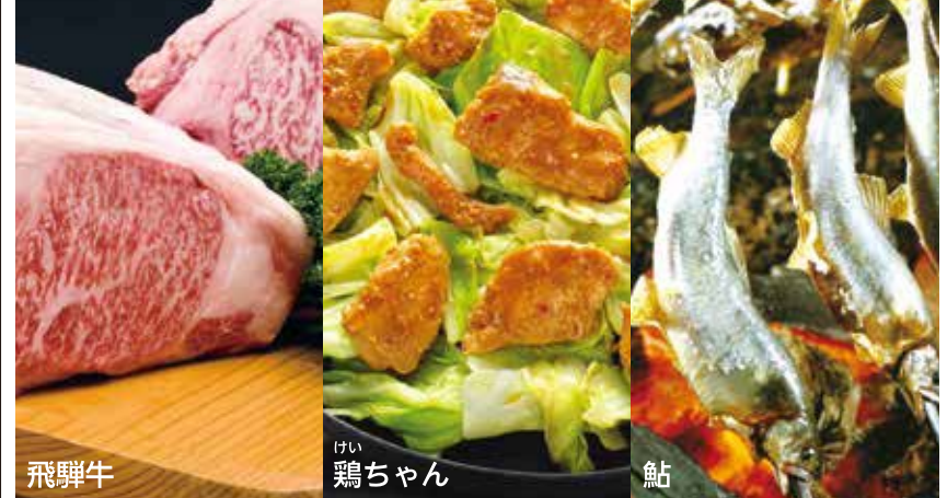
飛騨牛 鶏ちゃん 鮎

おでかけ前にはまずコチラ。目的地の情報満載！ 観光・歴史・自然・宿泊・グルメ・レジャー・カルチャー・イベントなど