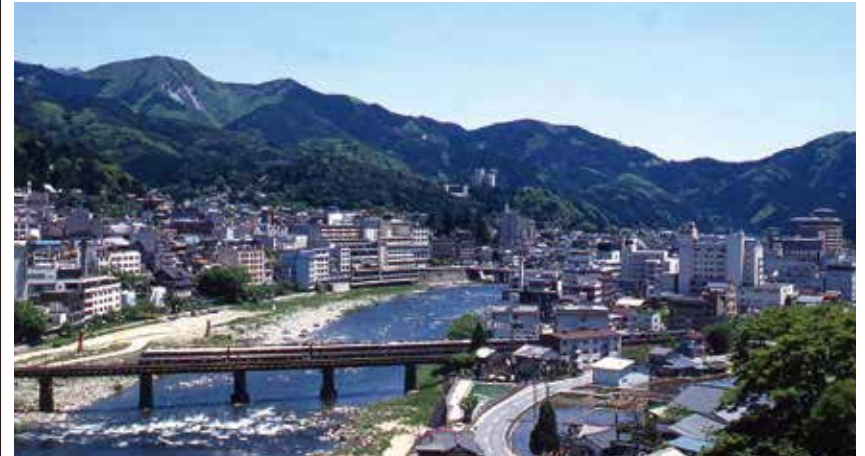
下呂温泉街 下呂市