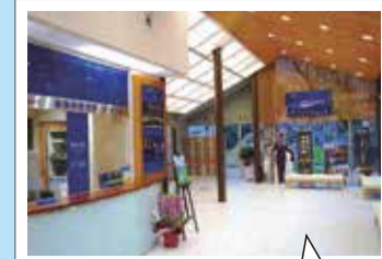
湘神社駅「和」を意識したデザインを取り入れ、ウッド調の落ち着いた雰囲気仕上っています。

フェラーリのデザインを手掛けた世界的な工業デザイナー「KEN OKUYAMA DESIGN」による全面ガラス張りのスタイリッシュなボディが人気。眼下に広がる長崎のまちを360度望めます。ロープウェイでの空中散歩をお楽しみください。