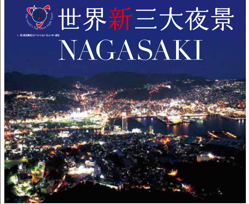
稲佐山からの眺め 長崎市