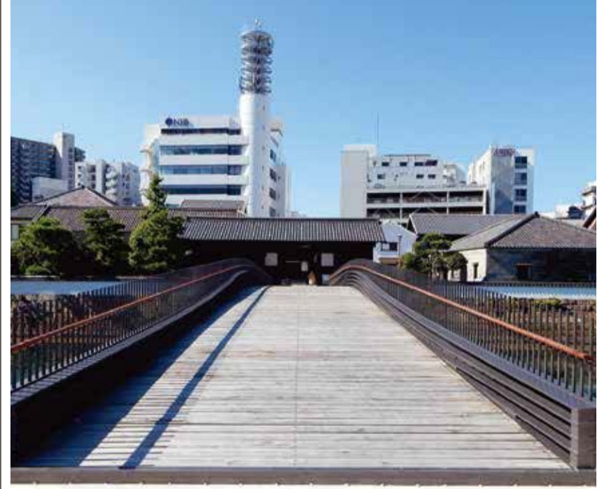
出島表門橋 長崎市