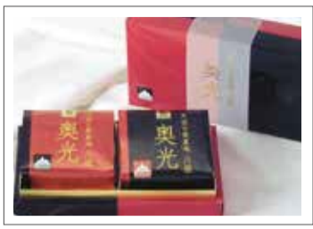
岡)大井川農協 茶業センター川根工場 TEL.0547-56-1142

■天空の茶産地 川根 奥光 ■黒ラベル奥光 水色は緑色で、甘味とコクがあり香ばしい香りが特徴です。甘い香りとコク、まろやかな旨味をお楽しみください。 ■赤ラベル奥光 水色は透きとおった金色で、お茶本来の渋味と香りが特徴です。心地よい渋味とスッキリした爽快感をお楽しみください。【川根本町】