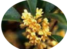
市の木「きんもくせい」