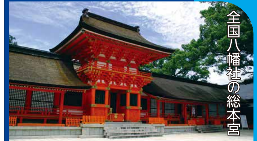
全国八幡社の総本宮

おでかけ前にまずコチラ。目的地の情報満載! 観光・歴史・自然・宿泊・グルメ・レジャー・カルチャー・イベントなど 英公社株式会社 http://wowmap.jp [おまマップ] [検索]