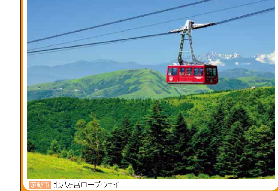
蓼科市 北ハケ岳ロープウェイ