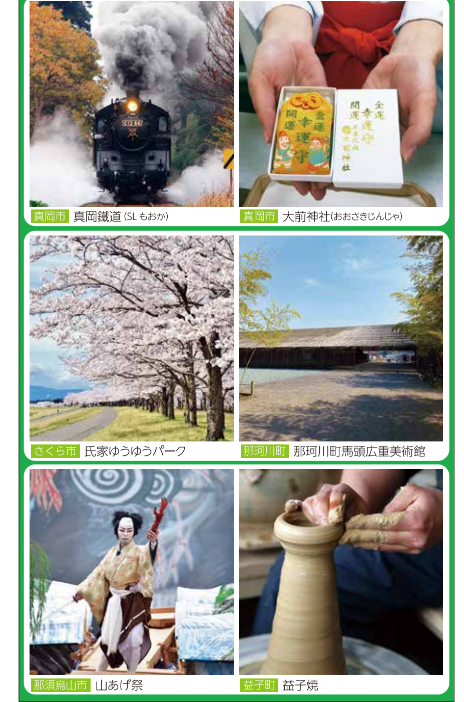
真岡市 真岡鐵道 (Sもか) | 真岡市 大前神社(あおさきじんじゅ) さくら市 氏家ゆづりパーク | 那珂川町 那珂川町馬頭広重美術館 那須烏山市 山あげ祭 | 益子町 益子焼

09 栃木県 さくら市・那須烏山市・真岡市・市貝町・高根沢町・那珂川町・芳賀町・益子町・茂木町