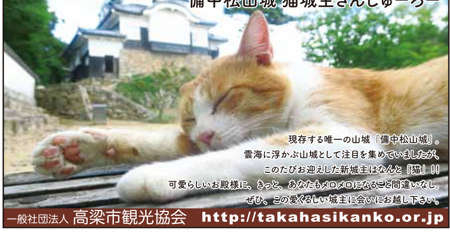
備中松山城 猫城主さんじゅーろー