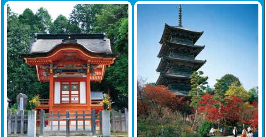
備中国分寺 (五重塔)