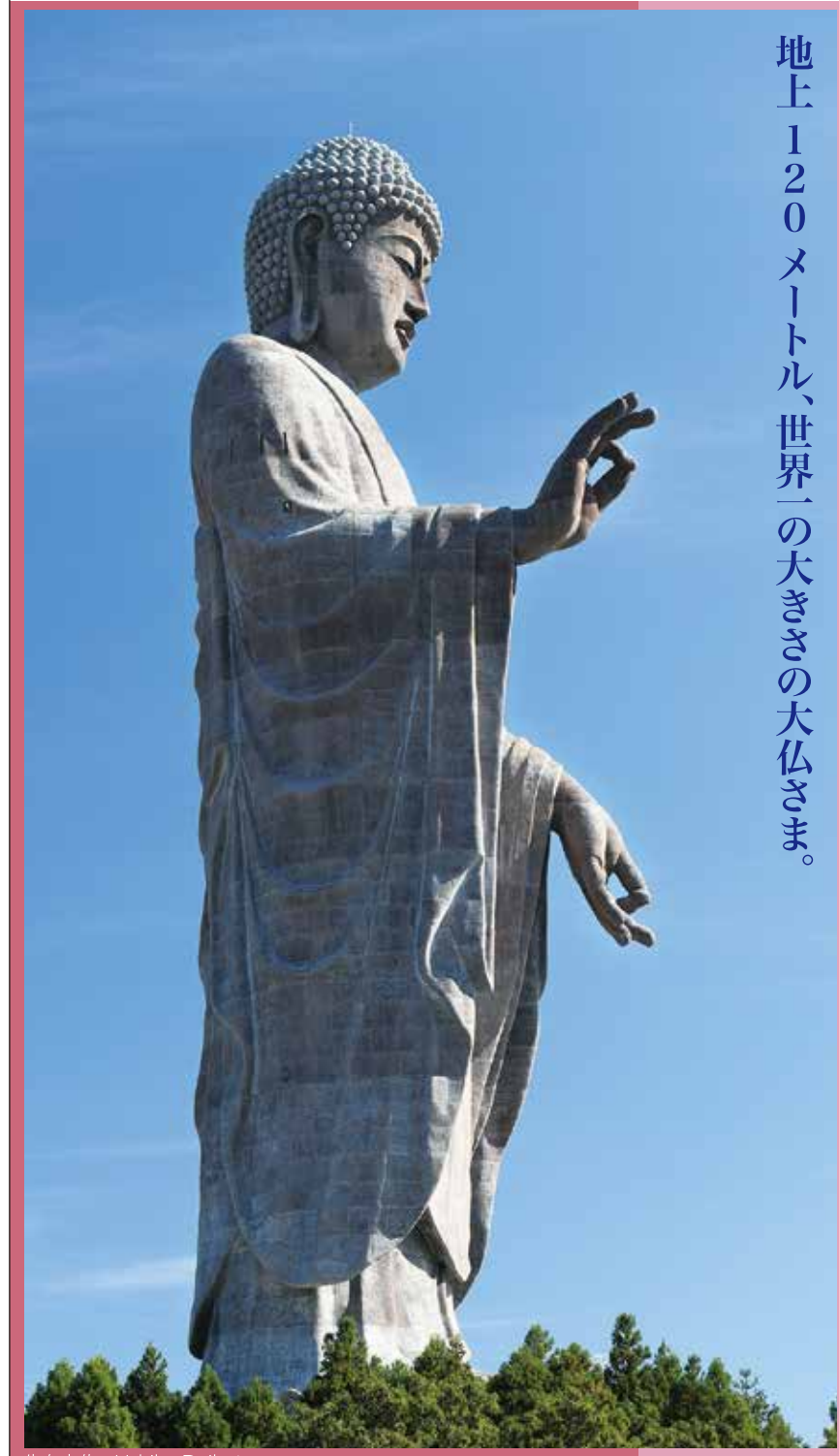
地上120メートル、世界一の大きさの大仏さま。

ひと目でわかる情報マップ地域やまちの魅力満載! https://wowmap.jp