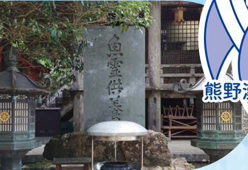
青岸渡寺の魚霊供養碑