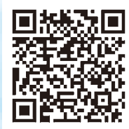
日本遺産「鯨とともに生きる」 史跡スポット

※一部チェックインスポットではない史跡や店舗も掲載しておりますのでご注意ください。