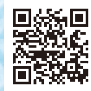
体験メニュー提供店舗