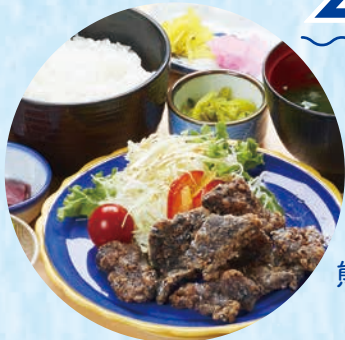
道の駅たいじ 鯨竜田揚げ定食

指定の日本遺産「鯨とともに生きる」関連のスポットや体験メニュー、 鯨を食べることのできる店舗などを巡り、 獲得したスタンプ数に応じて賞品が当たる抽選に応募できます！ 熊野灘地域の捕鯨の歴史と鯨とともに生きている文化を巡ってみませんか？