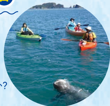
太地フィールドカヤック

指定の日本遺産「鯨とともに生きる」関連のスポットや体験メニュー、 鯨を食べることのできる店舗などを巡り、 獲得したスタンプ数に応じて賞品が当たる抽選に応募できます！ 熊野灘地域の捕鯨の歴史と鯨とともに生きている文化を巡ってみませんか？