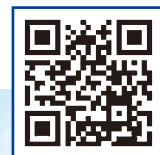
鯨とともに生きるホームページ