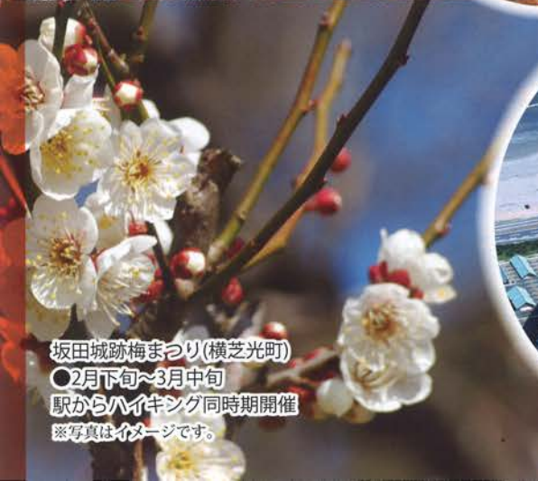
坂田城跡梅まつり(横芝光町) ●2月下旬~3月中旬 駅からハイキング同時開催 ※写真はイメージです。