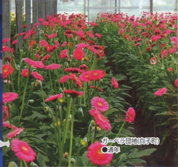
ガーベラ団地(白子町) ●通年