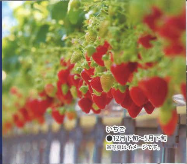
いちご ●12月下旬~5月下旬 ※写真はイメージです。