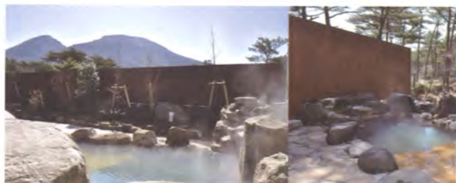
温泉露天風呂（男女各1箇所、宿泊者専用貸切露天風呂）

自慢の温泉は、毎分470リットルで自噴する、全て源泉掛け流しの炭酸水素塩温泉。露天風呂や貸切可能な家族風呂、サウナと施設も充実。日常のストレスや大自然を満喫した後の疲れた体を、芯から癒してくれます。