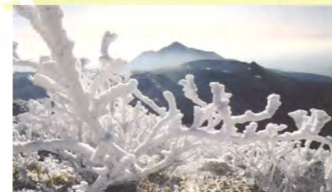
韓国岳からの霧島連山