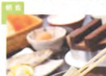
日本の米造り百選に選ばれたえびの産のお米「ひのひかり」を釜ごと炊きたてで提供いたしております。その他旬の食材に合わせた料理を取り揃え、アクティブな一日のスタートを応援するボリューム感たっぷりの朝食です。

えびの高原の大自然に囲まれて、食事のできるこのレストランは、旅のひとときをいっそう引き立ててくれます。