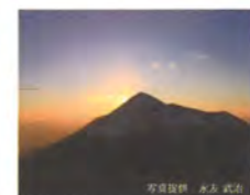
矢岳頂上からの朝日

えびの高原のある霧島連山一帯は、「霧島錦江湾国立公園」に指定されています。国立公園指定当時の指定条件は「わが国の風景を代表するに足る自然の大風景地であること」。この条件に相応しいエリアとして選ばれる理由となった「雄大で美しく、かつ変化に富んだ景観」が今も観光客を魅了しています。