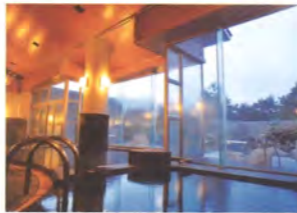
温泉大浴場（男女各1箇所）