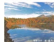
六観音御池の紅葉