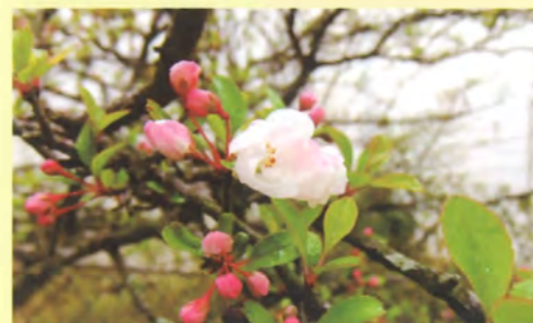
世界にここだけの花 ノカイドウ