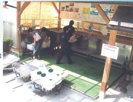
※採水地では白山命水を 1ℓ 52 円で計り売りしています。

弱アルカリ性、中程度の軟水で口当たりがまろやかでとても美味。 また、ミネラルを豊富に含み、からだにもおいしいのです！