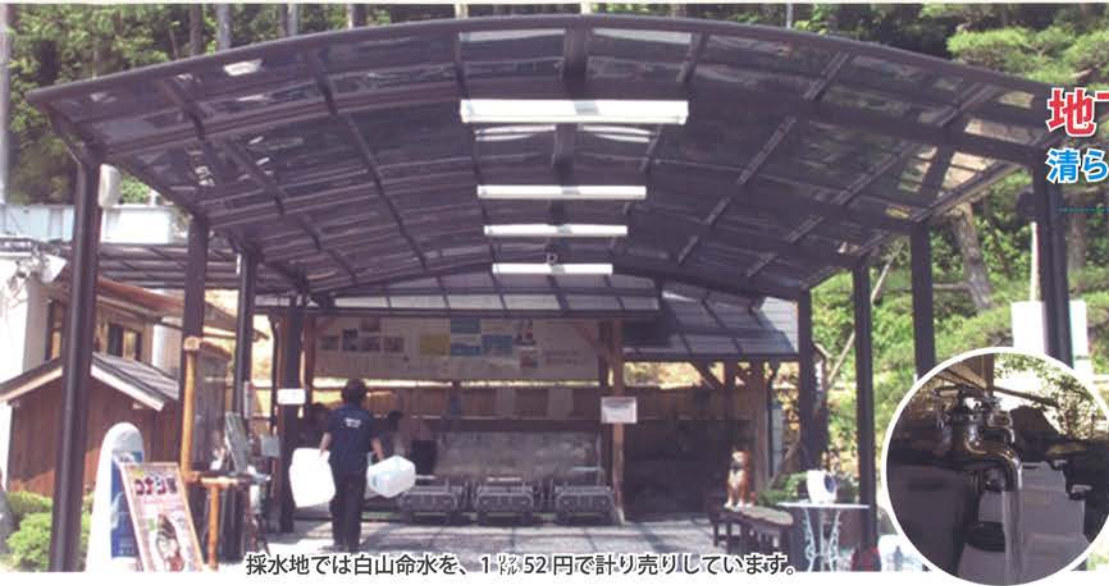
採水地では白山命水を、1ℓ52円で計り売りしています。

白山命水採水地は、鳥取県の倉吉市郊外。近くにあるラジウム温泉として有名な三朝（みささ）温泉と関金（せきがね）温泉の中間地点にあります。「白山命水」は、源泉井戸の深さ242mあまりの地下水を汲み上げています。空気に触れない花崗岩層など天然のフィルターを通し、ゆっくりと、じっくりと「ろ過」された、不純物を殆ど含まない清らかな太古の水です。