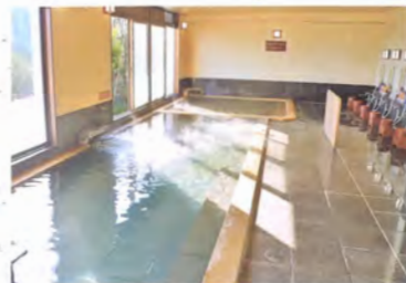
4階大浴場「ようよう」