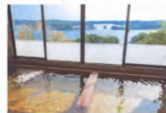
3階大浴場「さんさん」 露天風呂・ハーブサウナ (翌朝入替制)・ジェット バス・ひのき風呂等。湯 めぐり気分でお楽しみく ださい。