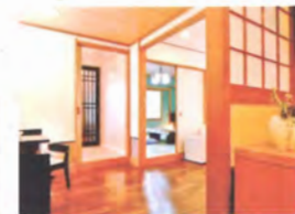
露天風呂付特別室 英虞湾を望む露天風呂(バリア フリー対応)で、夜には月や星、 朝には日の出をご覧頂けます。