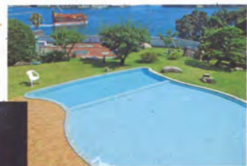
お子様プール 真珠貝の形をした大理石のプール です。(夏季のみ)

大切な人と過ごす このひとときを忘れ得ぬものに 思い出はさらさらと 輝く真珠の海のように 賢島の宿みち潮での時間が 楽しくゆつたりと 寛げるものでありますように