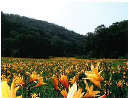
ニコウキスゲの群生