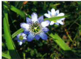
タテヤマリンドウ