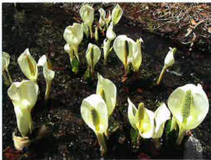
ミスバショウの群生