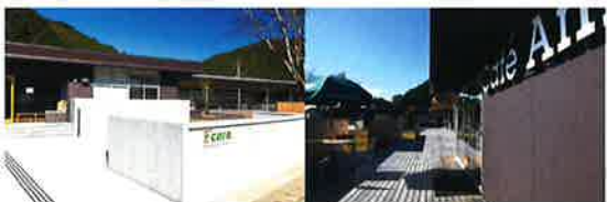
イコラ(多世代交流施設)

【住所】すさみ町周参見2341 ☎0739-33-7773 【営業時間】9:00~21:00(毎週火曜日は~17:00) 【休館日】年末年始 【カフェアメイゾン営業時間】9:00~21:00(フードは11:00~20:15)