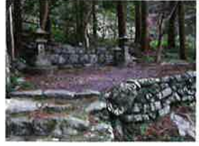
仏坂東上り口近く、入谷橋のたもとにある地主神社。巨石のある森が御神体で、社殿がないのが特徴です。