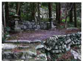
仏坂東上り口近く、入谷橋のたもとにある地主神社。巨石のある森が御神体で、社殿がないのが特徴です。