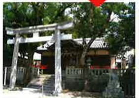
仏坂を下りてきたところにある周参見王子神社は、数十点の絵馬が奉納されていることで有名です(絵馬は歴史民俗資料館で保管)。