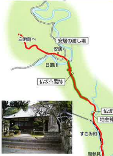
萬福寺は周参見駅近くの臨済宗妙心寺派の末寺で、ご本尊は阿弥陀如来像。長沢菅雪ゆかりの寺です。