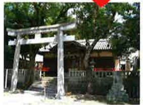
仏坂を下りてきたところにある周参見王子神社は、数十点の絵馬が奉納されていることで有名です(絵馬は歴史民俗資料館で保管)。