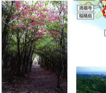
ウバメガシの原生林に囲まれた長井坂。4月下旬から5月初旬にかけては、ミツバツツジの群落の花が咲きます。