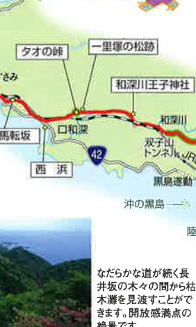
なだらかな道が続く長井坂の木々の間から枯木瀬を見渡すことができます。開放感満点の絶景です。