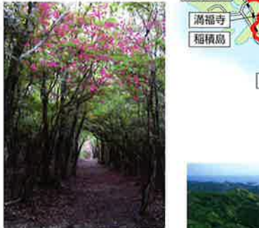
ウバメガシの原生林に囲まれた長井坂。4月下旬から5月初旬にかけては、ミツバツツジの群落が花をつけます。