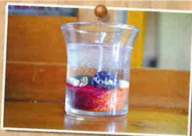
キャンドル作り体験

小高い山を少し登ると、わんぱく達に大人気のアスレチックコーナーがあります。二階から見る景色は最高です。