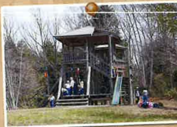
アスレチックコーナー

粘土からカタチを作る楽しさ。焼き上がりを楽しみ。自分の作品を実際に使う楽しさ。1回で3度楽しめる陶芸体験にチャレンジ!!