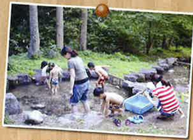
やまめのつかみ取り

谷川の清流を自然石で造った溪流にやまめを放流。子供から大人までつかみ取りは大人気です。その場で焼いたやまめの味は格別です。