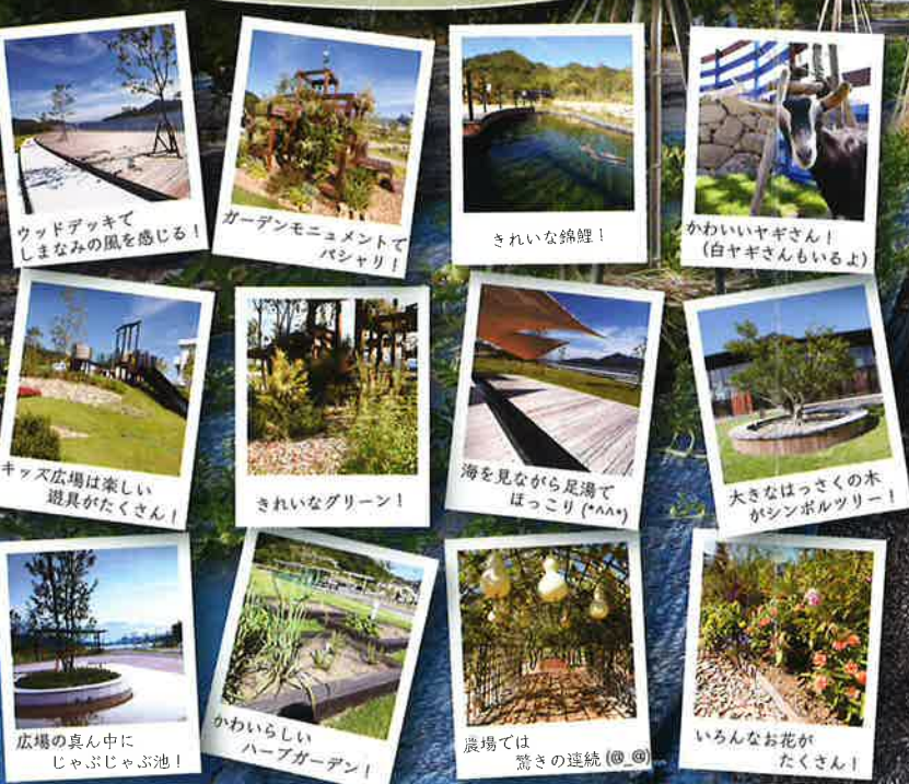
ウッドデッキでしまなみの風を感じる! ガーデンモニュメントでパシャリ! きれいな錦鯉! かわいいヤギさん! (白ヤギさんもいるよ) キッズ広場は楽しい遊具がたくさん! きれいなグリーン! 海を見ながら足湯でほっこり(♥♥♥) 大きなはっさくの木がシンボルツリー! 広場の真ん中にじゃぶじゃぶ池! かわいらしいハーブガーデン! 農場では驚きの連続(◎◎) いろんなお花がたくさん!