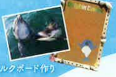
コルクボード作り

季節ごとに様々な手作り教室を用意しているよ。ドルフィンセンターの思い出を作って帰ってね。