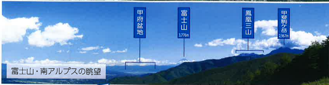
富士山・南アルプスの眺望