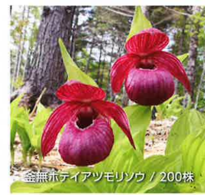
釜無ホテイアツモリソウ / 200株

甘い香りに包まれる癒し体験 すずらんの花言葉は「幸福が訪れる」「幸福の再来」。新緑が美しい入笠湿原では、あたり一面を埋め尽くす100万本の日本すずらんを迎えてくれる。どこまでも続く青い空と澄み切った空気。なつかしいすずらんの甘い香りに包まれる幸福の癒し体験。 幻の花 「釜無ホテイアツモリソウ」アツモリソウは、野生での絶滅の危険性が極めて高い絶滅危惧IA類に区分されており、「幻の花」と言われるほど希少価値の高いお花。野生ランの王者と言われる釜無ホテイアツモリソウを見ることができる。