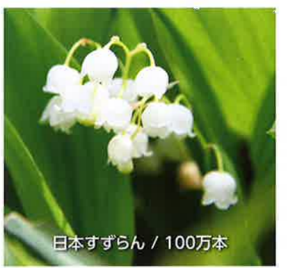
日本すずらん / 100万本