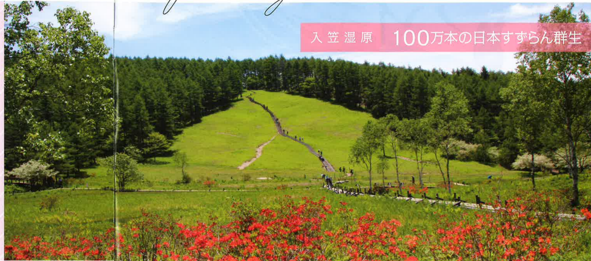
入笠湿原 100万本の日本すずらん群生

ゴンドラで標高1,780メートルまで一気に駆け上がり、そこは天空の花園。花の宝庫として知られる入笠山。遅い春の訪れを告げるザゼンソウが咲き終わると、入笠山にも美しい新緑の季節が訪れる。