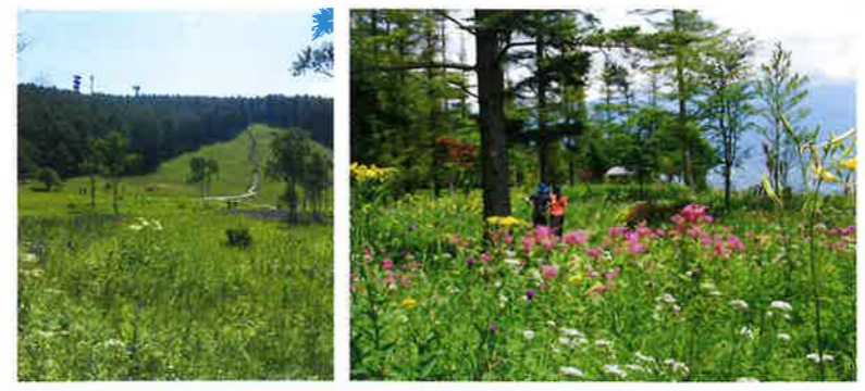
入笠山山頂 入笠山山頂

冬の作業車両試乗会 スノーマシン風速体験会 8/12(水)~8/15(土) 参加無料 スノーシーズンに大活躍する働く車を一堂に展示。スノーマシンの強力な風速体験や車両に乗り込んで記念撮影ができます。家族みんなで楽しめる夏のイベント。