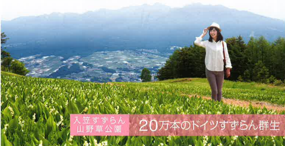
入笠すずらん山野草公園 20万本のドイツすずらん群生