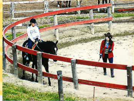
▲乗馬体験(レッスン) 乳しぼり体験