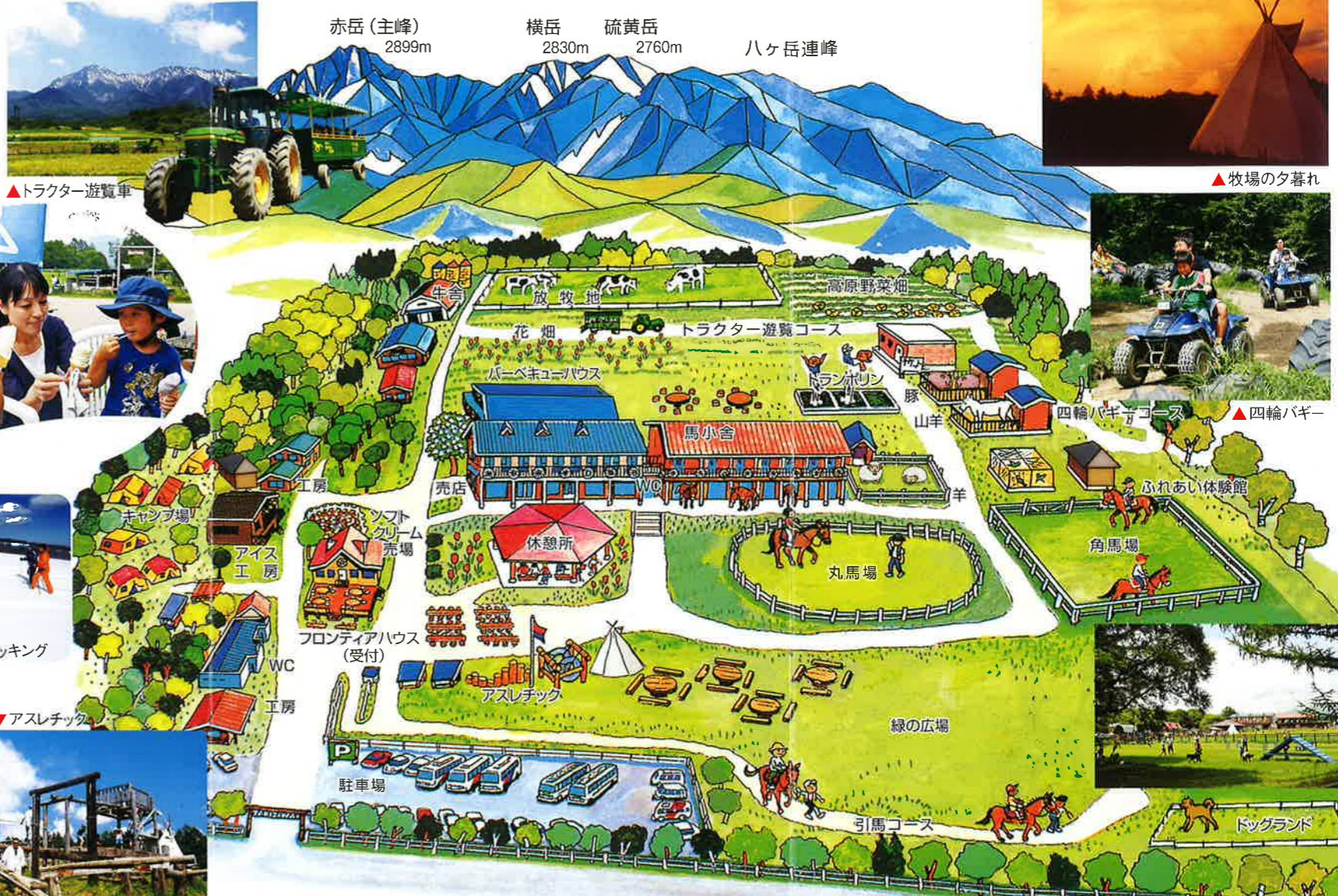
▲トラクター遊覧車

野辺山高原(標高1375m)にある滝沢牧場は、馬・牛・山羊・羊・うさぎ・鳥達をはじめ、多くの動物たちとふれあう事ができます。乗馬・乳搾り体験のほか、バーベキュー・フロンティアハウス(喫茶・受付)、ソフトクリーム、また搾りたての牛乳で作った手作りアイスクリームやばくじょうプリン、生キャラメルなど、滝沢牧場ならではの自慢の味も楽しめます。また、キャンプ場や、高原野菜畑・愛犬と遊ぶドッグランド・アスレチック・トラクター遊覧車・四輪バギー、トランポリン、それに牧場の宿(馬小屋)や売店などの施設も充実しております。大自然のなか、ゆっくりとリフレッシュして頂けるものと思います。冬季はスノーシュートレッキングが楽しめます。