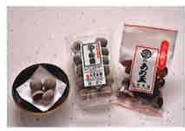
餛飩玉・松露 昔ながらの製法で作られた餛飩玉と松露。どこか心癒される素朴な味わいです。 ☎丸栄菓舗 TEL.0770-77-0113