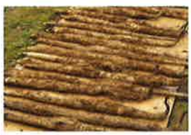
自然薯 名田庄の自然薯は、栄養・風味・粘り共に最高の品質を誇っています。 ☎名田庄商会 TEL.0770-67-2272