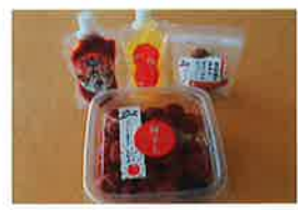
梅加工品 福井梅を使用した梅加工品。梅干しは懐かしい、いぶるさとの味わいです。 ☎うめっぼ TEL.0770-77-3344