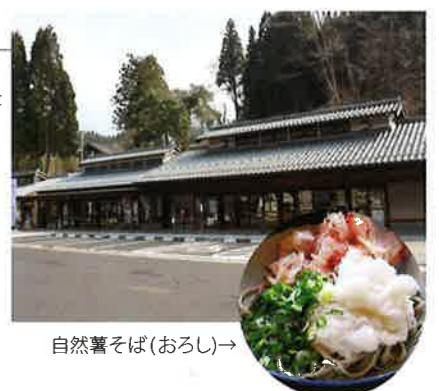
自然薯そば(おろし)→

地元の生産者から出荷された季節の野菜や果物、名田庄漬や自然薯そば、へしこなどの特産品を販売しています。 TEL.0770-67-2255 (営) 9:00~18:30 *季節により変動あり (休) 毎週水曜日 *夏休み期間中は無休 (第2・第4水曜日は営業) 年末年始 🚗 大飯高浜 IC から 25分 (約 17 km)