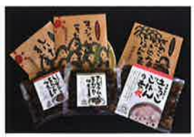
きのこ加工品 特産の採れたてのきのこを使用し、無添加で丁寧に作りました。 ☎おい夢工房 TEL.0770-77-3002

自然豊かで、山海の幸に恵まれたおい町。 お好みの味をピックアップして お持ち帰り下さい。