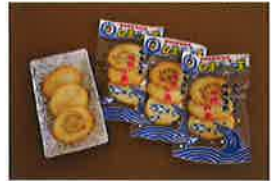
しまジャコ天 市場に出せない小魚などで作った旨味や栄養価値が高く人気上昇中です。 ☎島ジャコ倶楽部 TEL.0770-77-0441