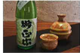
地酒(純米酒 妙正宗) 地元産の酒米を使いできるこの清酒は、飲みやすい辛口で、隠れた人気の品。 ☎兵助(株) TEL.0770-77-0013