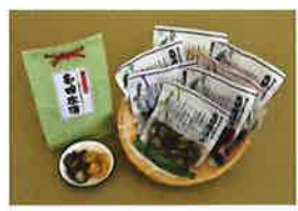
漬物(名田庄漬) 地元で育った新鮮な野菜を原料にし、じっくり漬け込んだ減塩の漬物。 ☎名田庄商会 TEL.0770-67-2272