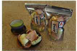
かき餅・栃餅 地元産の餅米、栃の実を使った昔懐かしい味わい。 ☎スイート木の実 TEL.0770-78-1748