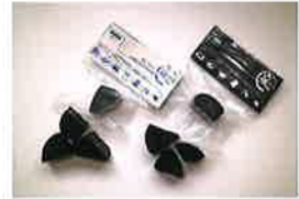
研磨炭・木炭 日本でおおい町でしか生産されていない研磨炭。貴重な品々です。 ☎名田庄総合木炭生産組合 TEL.0770-67-2908

(一社) おおい町観光協会 TEL.0770-77-1734 〒919-2111 福井県大飯郡おい町本郷153-1-2 お楽しみ情報満載のホームページ http://www.wakasa-ohi.jp/ Twitter: https://twitter.com/Ohii_Tourism Instagram: https://www.instagram.com/ohi_tourism_sea/ Facebook: https://www.facebook.com/OhiiTourismAssociation YouTube: https://www.youtube.com/channel/UCUsV-VzhoBxgq3k6JLwYgcQ