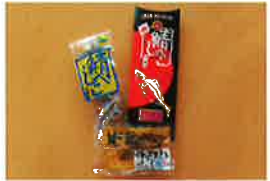
鯖のへしこ 昔ながらの製法で糠、塩に漬込んだり、熟成させて自慢の逸品。 ☎たまてばこ TEL.090-6274-0085