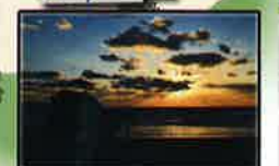
日本遺産「日が沈む聖地出雲」 稲佐の浜の綺麗な夕日がライブ映像で見れます。(3ヶ所のモニター)