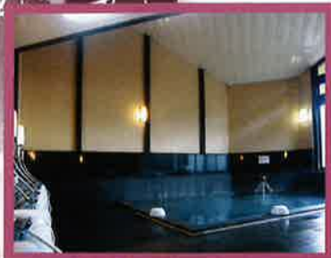
ゆったりとした内風呂から外へ踏み出すと 大展望の露天風呂が広がります