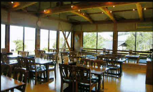
食堂コーナーでは気軽にお召し上がりいただけるメニューを取り揃えております