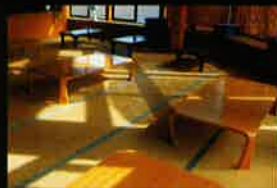
疲れた体をしばし休めていただける休憩室