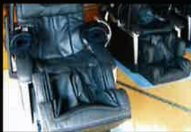
湯上がりにマッサージはいかがですか