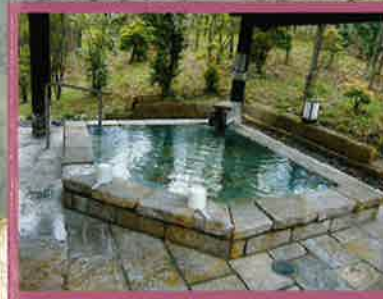
源泉かけ流しの石風呂は 湧き出るお湯をお楽しみ頂ける特等席です

湯の川温泉の湯は日本三美人の湯に共通する 弱アルカリ泉で、古い角質を落し、 保湿効果があるといわれています さらさらとした湯あたりですが 湯上がりには不思議とつるつるとした感触に…… それはまるで美肌をつくる魔法のお湯のようです