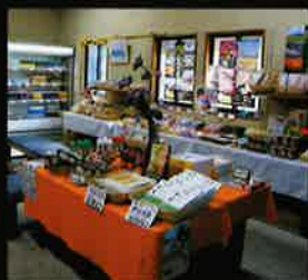
斐川の特産品をはじめ、お土産に喜ばれる品々を取り揃えております