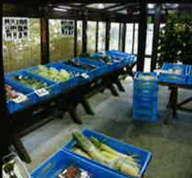
地元生産者による野菜市は、新鮮で安価と人気スポットの一つです