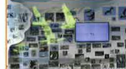
入口の「バードウォール」には周辺で見られる野鳥がズラリ! ~毎時00分に注目!!~ 「鳥のカラーシールド」が登場するよ