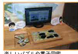
楽しいパズルや電子図鑑