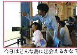
今日はどんな鳥に出会えるかな?

宍道湖・中海ってどんなところ?ラムサール条約ってなんだろ?自然環境や生きものことなど、楽しみながら関心を深めることができる展示があります。