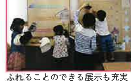
ふれることのできる展示も充実