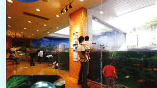
淡水と海水の生きものの両方が息する特異な汽水域。どんな生きものがあるでしょう。