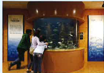
入口正面には大型の円形水槽。ここが島根の水辺の旅の始まり。