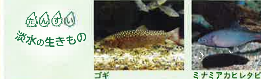
ゴギ ミナミアカヒレタビラ インドジョウ オヤニラミ イシドンコ