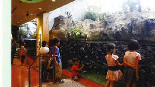
川やため池、水田など身近な水辺にくらす生きものとその豊かな生息環境をみてみましょう。