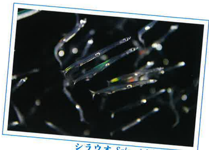
シラウオ Salangichthys microdon