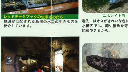
川やため池、水田など身近な水辺にくらす生きものとその豊かな生息環境をみてみましょう。