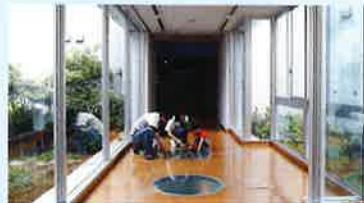
館内へと進むわたり廊下。屋外の池には日本産のカメや淡水にすむ魚たちの姿があります。床にある丸い窓から泳ぐ姿を観察できます!