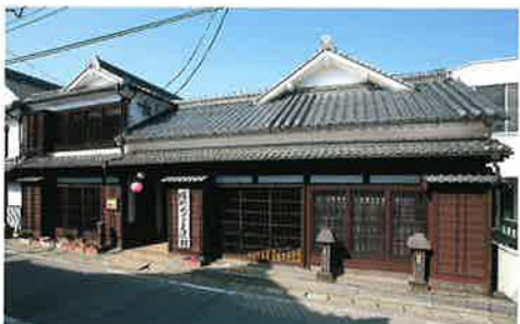
横町町家交流館では町並みの魅力や歴史を紹介しています

八女福島の町家は土蔵造りが多く、商家的な色彩と職人の工房的な色彩を併せ持った町並みで、伝統工芸品の工房・店舗が多いのも特徴です。工芸的な造りは特に町並みの西側に多く集中しています。江戸、明治、大正、昭和初期の伝統様式の150軒ほどの建物が旧往還道路沿いに連なっています。