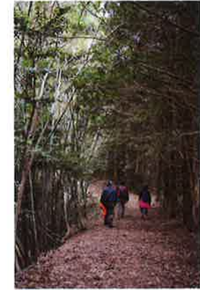
天然のさくさくじゅうたん 秋にはクヌギの葉が敷き詰められ、まるで天然のじゅうたん！

極上のあぜみち 畦道の傍らには清らかな小川が流れ、静かにたたずむ古民家。まさに極上！