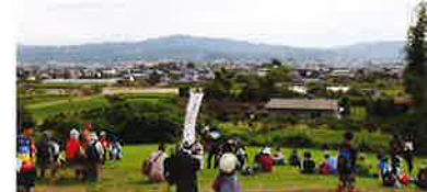
八女のランドマーク「飛形山」