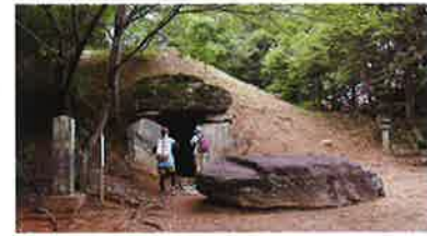
童男山古墳 6世紀後半に築造された大型円墳。石室に入れます。