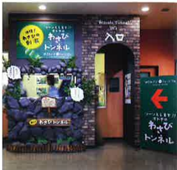
からーい！わさびトンネル

A わさびを知ろう！ 5分でまなべる！ 伊豆わさび mini ミュージアム IZU WASABI MUSEUM