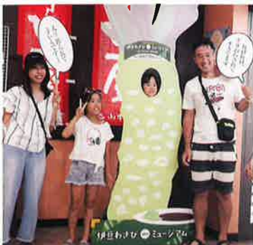
顔出しパネルではい！チーズ