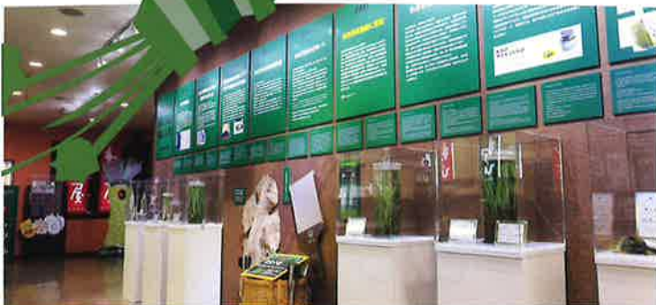
5分でまなべるわさびの展示（英語、中国語表記あり）。自由研究にも！