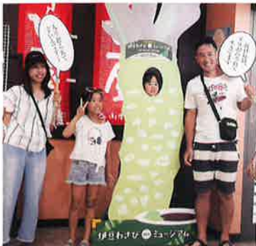
顔出しパネルではい！チーズ