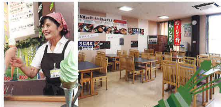
わさび塩をかけて