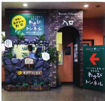
からーい！わさびトンネル