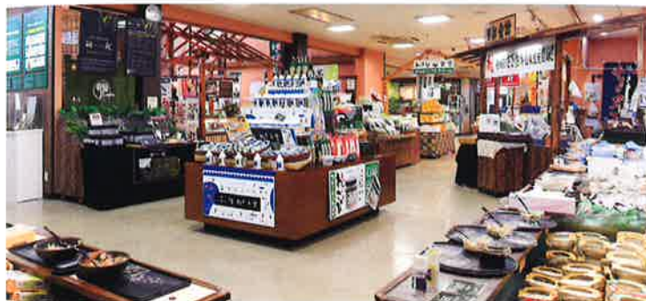
わさび漬けをはじめ、静岡名産のお土産、わさびのお土産がズラリ