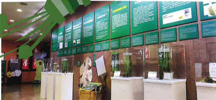
5分でまなべるわさびの展示（英語、中国語表記あり）。自由研究にも！