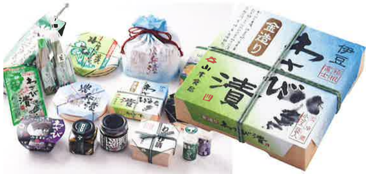
山本食品のオリジナル商品