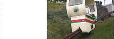
障害者専用のスローカー

障害者はもちろんお年寄りまで、だれもが楽しめるように園路の勾配はゆるやか(5%以下)になっています。そして50mごとに休憩スペースが設けられ車イスでの単独行動を可能としています。全ての建物には車イスで入れます。また、車イスのまま乗車できる「こどもの国列車(冬期間は運休)」、車イスが配置されています。