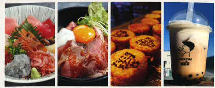
館内には、レストランからテイクアウトショップまで、様々な“美味しい”が集まっています！