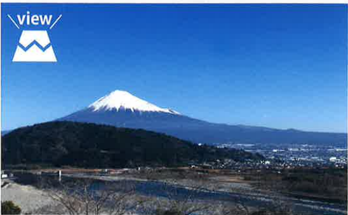
絶景が楽しめる無料の展望ラウンジ。飲食の持ち込みが可能で、休憩スペースとしてもご利用いただけます。また、ラウンジ内には自由に弾けるストリートピアノ（10:00～16:30）を常設しています。