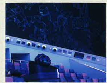
プラネタリウム わいわい劇場