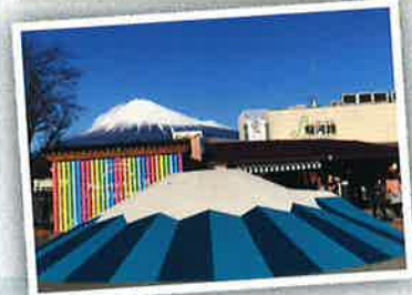
↑富士山モニュメント「にこるじ」は人気のフォトスポット