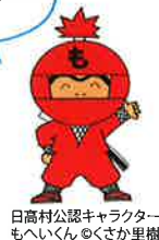
日高村公認キャラクター もへいくん ©くさか里樹