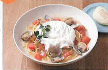
あさりトマトのだしバゲッティ...900円 紫芋のしほりたてモンブラン...600円

おうちごはん、おかあさんの手料理をテーマとした食堂カフェ。“だし”にこだわった、和洋様々な料理が楽しめます。