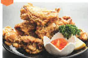
マヨ唐チキン 5ピース…1,000円 鬼わらい五平ちゃん…300円

「マヨ唐チキン」でお馴染みの正盛。岐阜の「郷土食」や夏の炭焼「鰻」、冬の「牡蠣フライ」はリピ率が鬼!! 予算に合わせた「献立料理」や、各種定食も大好評!! ※献立料理 要予約2,000円、4人前~