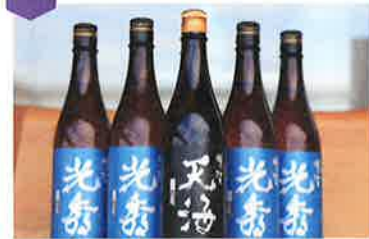
明智光秀(720ml)…1,089円(税込) 明智天海(720ml)…1,474円(税込)

明智光秀の出生地とされる明智城跡の南側に位置する1874年創業の酒蔵。代表銘柄は「美濃天狗」「明智光秀」「富興」