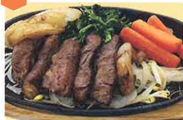
国産牛ステーキ定食…1,880円(税込)

湯の華アイランド広場内「湯の華市場」にあるフードコート式の食事処。麺類や国産牛が味わえる贅沢なお店です。