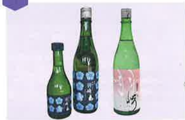
純米羽崎~山崎より羽崎~(720ml)…1,550円(税込) (300ml)…600円(税込) 純米羽崎 生原酒(720ml)…1,485円(税込)

ふるさとのおいしいお酒を販売。可見の米からつくられた清酒「純米・羽崎」は飲む価値あり!