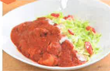
バターチキンインドカレー...1,019円 野菜たっぷりロコモコ...1,019円

目の前に広がるバラ園にホッと一息。心身ともに癒やされるカフェです。大河ドラマ「麒麟がくる」にちなんだメニューもあり。