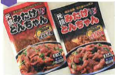
元祖みたけとんちゃん ピリ辛みそ味、甘辛みそ味(220g)…360円

豚のホルモンを鉄板で焼く、歴史ある郷土料理。戦時中から愛されてきたみたけとんちゃんは一袋一袋手作りで。お土産やBBQに最適の1品!