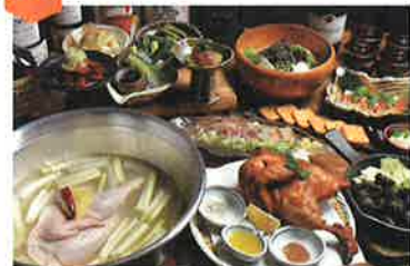
雛鳥の素揚げ…1,408円 絶好鶏の水炊き 1人前(2人前より)…1,408円

全ての商品のテイクアウトが可能です! 可児の中心地「広見」の鶏専門居酒屋。名物絶好鶏の水炊き・雛鳥の素揚げ・さつま知寛どりの籠炙りが大人気!