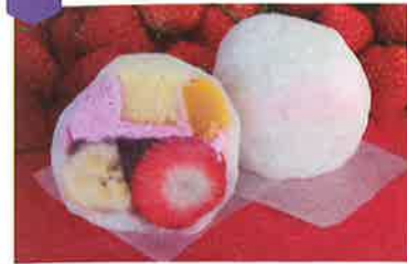
ミックス大福(1個)…270円~ ※苺は12月より 花どら(1個)…160円

明治23年から続く和菓子屋さん。昔ながらの和菓子から創作和菓子まで幅広く販売しています。ふわふわな生地に包まれた季節のフルーツがはいった大福は♡を満ちた優しい味わい。手土産にも喜ばれること間違いなし!