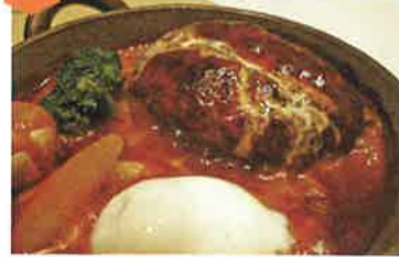
煮込みハンバーグ...1,600円 (サラダ、ライスまたはパン、デザート、コーヒーまたは紅茶)

オードブルからデザートまで、料理はすべて手作り。個室もあるので記念日や商談も◎!落ち着いた雰囲気の中でおいしい食事はいかがですか?