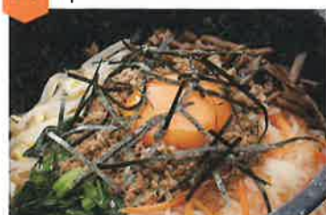
石焼ビビンバ…1,280円(税込)

湯の華温泉内にあるレストラン。11:00までのモーニングはファンが多く、平日も賑わっています。お得なランチメニューもオススメ。