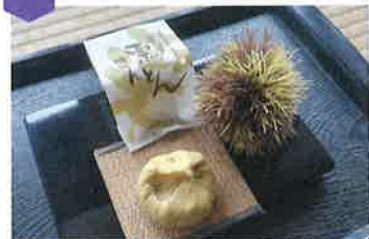
栗きんとん(1個28g)…180円 くずばー(1本95g)…170円

自家栽培した栗を使った栗きんとんが名物です。市田柿の中に自慢の栗きんとんを入れた王柿、葛を使ったくずばーは絶品!