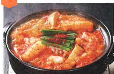
赤から鍋ランチ…935円 赤から鍋(0~10番)(2人前より)…1,089円

テイクアウトはもちろん! 事前予約でお弁当もご用意可能です! 名物赤から鍋と鍋の他にも、大人気の焼き肉まで楽しめるお店です。家族や友人とお気軽にお越しください。