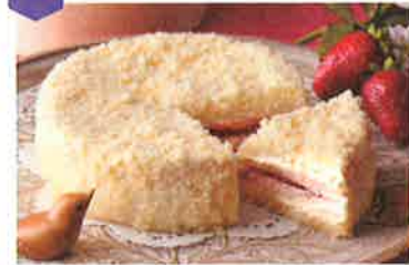
濃姫フロマージュ…1,350円 フルーツタルト5号…3,300円

地産地消や旬の素材を使用し、真心こめて作り上げた個性あふれるお菓子が美味しさとともにお客様をお迎えします。