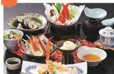
かに膳 1人前…3,982円 ランチ弁当…600円 会席弁当…2000円~

可児といえば「可児かまど本店」地域の特産品や旬の食材もたくさん! 大型宴会場、個室もございます! テイクアウト、仕出し弁当も承っております。