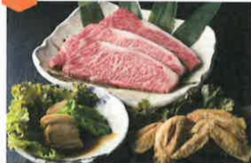
仕出し弁当...1,000円~ ぶりしゃぶ鍋...時価 季節によって内容や金額に変動あり。お問合せください。