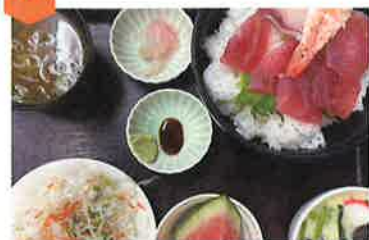
日替わり定食(豚かつ、天ぷら、丼など)幕の内弁当、種定食…680円(税込)~ テイクアウト(要予約)幕の内弁当、とんかつ弁当、唐揚げ弁当…600円(税込)~

可児川を眺めながらゆったりとくつろげる店内でボリューム満点の日替り定食、栄養バランスの取れた幕の内弁当をどうぞ。お持ち帰りのお弁当もお気軽にお問合せください。