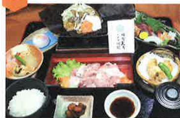
光秀御膳…2,300円 ※写真はイメージです。

食事処は軽食から会席料理まで豊富なメニューで毎日食べても飽きません。美味しい食事と天然温泉で身も心もリフレッシュ。