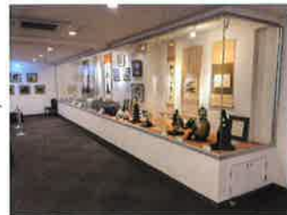
ショーケースフロア