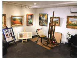
名誉館長兼アトリエ