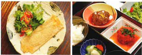
地元産そば粉を使ったガレット

広々とした日本建築の中のおしゃれな雰囲気のレストラン。自然で暖かく身体に優しいお食事も魅力です。藤井商店のお肉も食べられます。