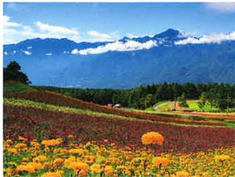
百日草と南アルプス【花の里 ロマンスエリア】

●富士見高原リゾート 花の里 富士見町 12067 ☎0266-66-2121 http://fujimikogen-resort.jp/