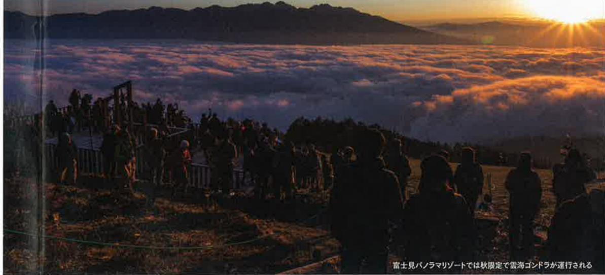
富士見パノラマリゾートでは秋限定で雲海ゴンドラが運行される