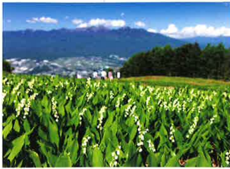
ドイツすずらんとハケ岳 [富士見パノラマリゾート ゴンドラ山頂駅付近]

季節の訪れを告げる花々 4月、富士見に花の季節が訪れる。一斉に花開くダンコウバイ、梅、コブシ…。春の盛りを彩るしだれ桜。梅雨の頃にはすずらんの薫りが湿原を包み、太陽が眩しく輝くと夏の花々の競演が始まる。花々が次々に咲き変わって一面を鮮やかに染めあげる「入笠湿原」。カラフルな色彩が夏を謳歌する「花の里」。やがて高原に秋風が立つと、山裾にひっそりと白いそばの花が咲き、華やかな花の季節に終わりを告げる。