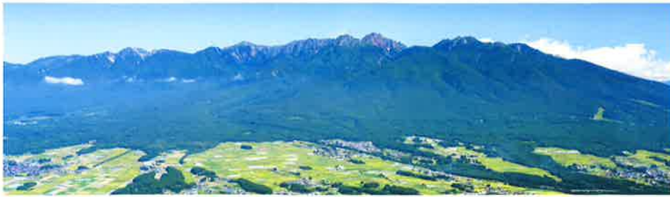
富士見パノラマリゾートより望む八ヶ岳