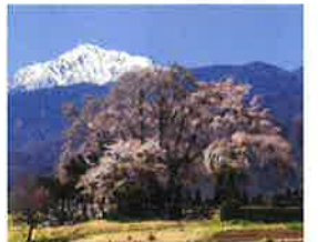
田端しだれ桜 富士見町には樹齢200年を超えるしだれ桜が4つあり、名峰とのコントラストも見事。それぞれ違った趣きを見せてくれる。