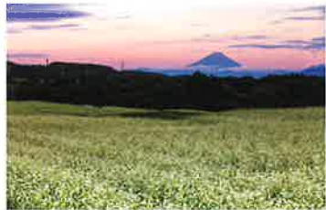
そばの花と富士山【葛窪】