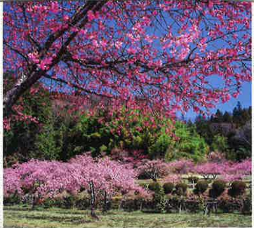
②(上高木・三光寺)(2019.4.8 AM10:43) 境内で際立って紅い河津桜を発見。前日に昨年の取材ノートと実写ボジを見直し、当日の取材に臨んだ。