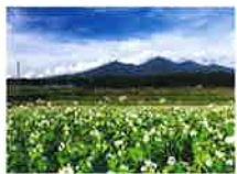
そばの花とハケ岳【乙事】