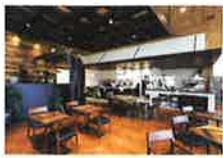
II FAGGIO イル・ファジジョ(レストラン)