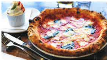
レストランでは旬の野菜を使ったメニューを味わえる

●カゴメ野菜生活ファーム富士見 富士見町富士見 9275-1 ☎0266-78-3935 http://www.kagome.co.jp/yfarm 営業期間：4月～11月 定休日：火曜日