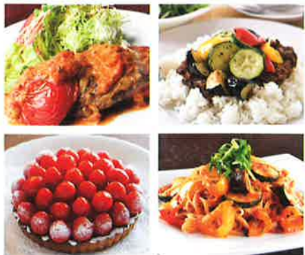
高原野菜メニューのイメージ

「高原野菜グルメサミット」で旬の高原野菜メニューを味わう 富士見高原で丹精込めて野菜を育てる生産者と、その新鮮なおいしさに惚れ込んだ料理人たちがコラボレーションした「高原野菜グルメサミット」。レストランやベーカリー、洋菓子店などが工夫を重ねて開発したメニューは、高原野菜をたっぷり使ったオリジナリティあふれる料理ばかりで、食べるだけで心も体も元気になれるそう。この夏は、富士見の「高原野菜グルメサミット」で、旬の贅沢を存分に味わおう。開催期間 6月～9月