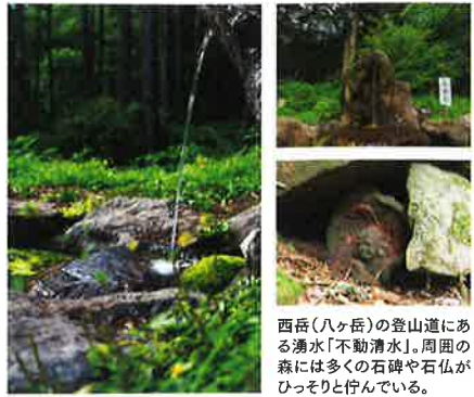
西岳(八ヶ岳)の登山道にある湧水「不動清水」。周囲の森には多くの石碑や石仏がひっそりと佇んでいる。

八ヶ岳は山岳信仰の山としても知られ、江戸時代には多くの修験者がいたという。信仰にまつわる伝説はいくつも残されていて、富士見からの登山道にある湧水は、不動明王を祀ったところ清水が湧き出したことから、「不動清水」と名付けられたと伝えられている。岩陰には不動明王が刻まれた石碑、モミの木の下には小さなお地蔵様。山岳修験霊場の名残を残す「不動清水」は、まさに富士見最強のパワースポット！