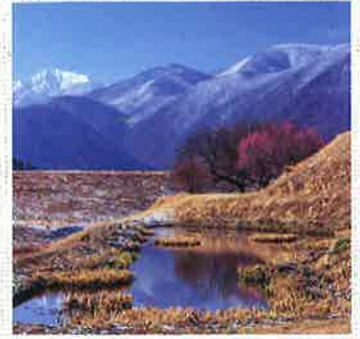
①(井戸尻史跡公園)(2019.3.5 AM9:15) 早春の温もりを感じさせてくれる紅梅。穏やかな日差しにダウンジャケットを脱いだ。

富士見町の自然を追い続ける写真家、玉置弘文さんの作品とともに、四季の彩を探る旅に出かけましょう。