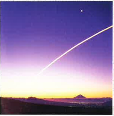
⑦(富士見高原・創造の森)(2018.12.31 第1EXP・夜景PM5:42~)(2019.1.1 第2EXP・朝焼AM6:24~)(2019.1.1 第3EXP・光跡AM7:03~11:05) 時間をテーマとして不可視の世界と太陽を光跡として表現した作品。