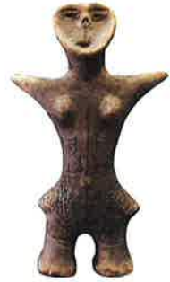
始祖女神像 (板上市跡の土偶/重要文化財)