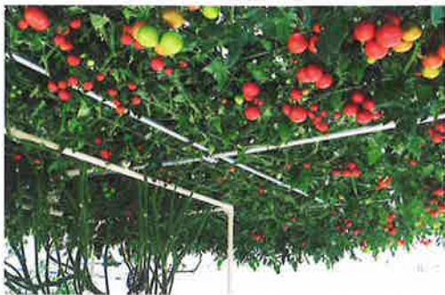
ファームハウスの別棟にある「トマトの樹」は1粒の種から1万個の実をつける

「カゴメ野菜生活ファーム富士見」のコンセプトは、「農業・工業・観光」が一体化した体験型「野菜のテーマパーク」。迫力の映像や展示で「カゴメのこだわり」を体験できる工場見学施設「ファクトリー&ミュージアム」、菜園から収穫した野菜で、料理・スイーツ作りなどを体験する「体験教室」、野菜を“美味しく、楽しむ”イタリアンレストラン、採れたて野菜や特産品が揃ったファームショップなど、様々な施設が揃っている。工場見学や体験教室などは、事前の予約が必要。