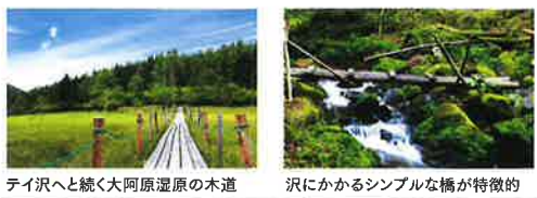
テイ沢へと続く大阿原湿原の木道 沢にかかるシンプルな橋が特徴的

大阿原湿原から流れ出た水が、自然林の中に美しい流れを作る「テイ沢」。渓流の岩をびっしりと覆った苔は、水分を含んでピロッドのように輝き、秘境と呼ばれるにふさわしい神秘的な雰囲気漂わせる。人の訪れも少ないテイ沢には、オコジョやホンドテンなども棲んでいて、運がよければ岩陰からひょっこり顔を覗かせたりするとか。いくつもの木の橋を渡り、きれいな空気をいっぱい吸いながら歩くテイ沢トレッキングは、癒やし旅という言葉がぴったり。