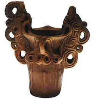
水煙渦巻文深鉢 (曾根遺跡第4号住居址/長野県宝)

日本遺産に認定された「星降る中部高地の縄文世界」。八ヶ岳山麓には縄文文化を探る上で重要な箇所があり、その一つが井戸尻遺跡群とされている。未だ謎に包まれた縄文世界への扉を開くなら、井戸尻考古館を訪ねるのがいい。館内には土偶、土器、石器等が展示され、出土品からは、縄文時代にすでに農耕が行われていたこともわかっていられる。土器が物語るのはそれだけではなく、あの複雑な造形は、縄文の人たちの世界観、宗教観、当時すでに語り伝えられていた神話的な世界を表現しているのだという。そして、その神話王国の中心ともいえるのが富士見なのだとか。縄文人のパワーを感じる「縄文の里 富士見」。山々を望む遺跡に立てば、古代ロマンに心がときめく。