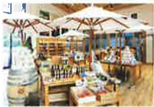
ファームショップ

CHECK! ファームショップにあるショップ限定のオリジナル商品は、お土産にもオススメ。