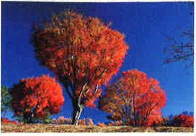
⑥(立沢・ヨドバシカメラ富士見高原研修センター)(2019.11.15 AM9:22) 紅葉の色づきが今ひとつだった中、ひときわ存在感を見せた楓。このような構図は初めてだったので、熱が入った。

して表現する作品の撮影に臨んだ。こうした写真は冷静さと集中力が必要だと改めて実感する。木々がすっかり葉を落とすと、全く異なった風景が広がる。入笠林道には、風雪に耐えた木々の合間から、真っ青な空に浮かび上がるように八ヶ岳連峰がくっきりと聳え立っていた。季節ごとの美しい景観が広がる富士見。ぜひ多くの人に体感してほしいと思う。