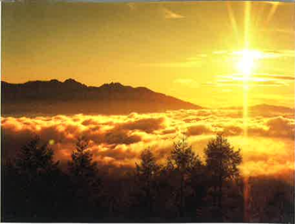
⑤(林道入笠線・ハヶ岳ビューポイント)(2019.9.6 AM5:51) 光と水蒸気が織りなす朝のドラマ。刻々と変わる雲海の姿に神経を集中させる。これぞ雲上の特等席。

凍った風が和らぐと富士見に花の季節が巡ってくる。3月、井戸尻公園に春を告げる紅梅が咲く。白雪の甲斐駒ヶ岳と鮮やかな紅梅は、早春の温もりを感じさせてくれる風景だ。富士見の桜の開花は4月も半ばを過ぎてからだが、4月に入って間もなく、三光寺境内の桜林で河津桜の美しい姿を発見した。他の桜に先駆けて咲く河津桜は際立った紅色が美しい。 桜の季節が過ぎ、入笠山登山道の新緑がまばゆく輝くと、本格的な花の季節が始まる。入笠山のお花畑は、近年鹿の食害が減り、咲く花の種類も増えてきている。この日は、レンゲツツジと蓼科山遠望、そして風流に流れる雲という会心の一枚が撮影できた。花のスポットといえば、「富士見高原花の里」もまさに百花繚乱の風景だ。日差しが強くなりすぎる時間を避け、足しげく通うことになる。