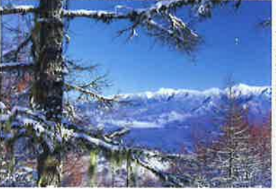
⑧(林道入笠線)(2018.12.17 AM9:50) 入笠山林道の深い森の合間から見えた白銀のハヶ岳連峰。すぐにカメラを三脚にセットしてポイント探しを始めた。