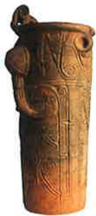
神像筒型土器 (藤内遺跡第32号住居址) 国重要文化財

縄文アートを堪能したら、古代ハスなどの水生植物が咲く井戸尻史跡公園をのんびり散歩してみよう。