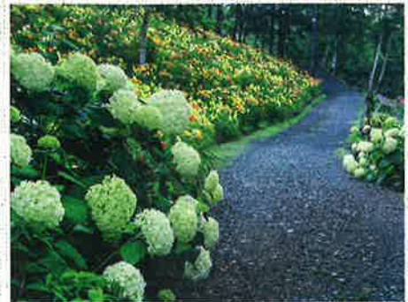
④(富士見高原・花の里)(2019.7.29 AM6:44) 紫陽花とヘメロカリスの花に沿って続く遊歩道を陽が差し込まない早朝の時間帯を選んで撮影。木陰のベンチは何時も気分爽快。