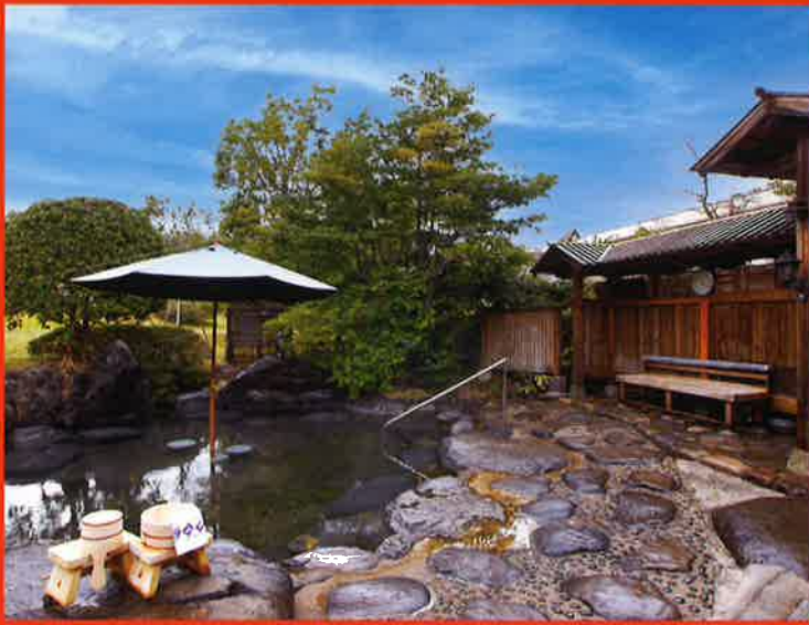
山紫苑名物の庭園露天風呂「堀の湯」