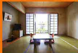
新館「入道雲」(和室8畳)