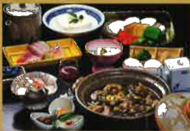
スッポン鍋コース