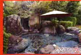
庭園露天風呂「大石の湯」