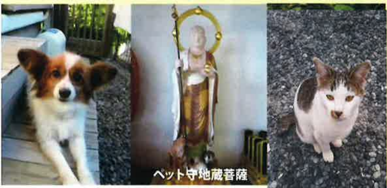
ペット守地蔵菩薩

県下では最初にペット供養・火葬・霊園を始めペット専用のお寺「愛受院」を建立し、人とペットとの関係の大切さを説いてまいりました。ペットを愛する人々からはペットの健康・幸せをかなえる仏さまのペット寺院として信仰されております。