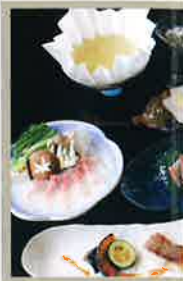
希少なチョウザメ