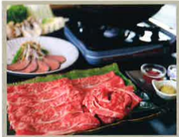
とろける味わいの但馬牛

世界中のグルメがうなる『但馬牛』。肉そのものの味がいいだけでなく、赤身と脂の旨さが絶妙。まさにとろける味わいの但馬牛をぜひご賞味ください。