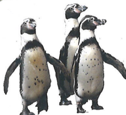
フンボルトペンギン