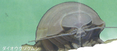
ダイオウグソクムシ