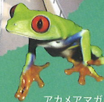
アカメアマガエル