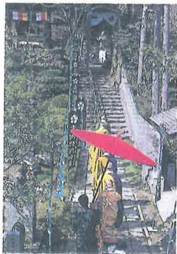
四月一日 土砂加持法要の行堂

平安時代後期 奥ノ院遍照院の本尊 もとは酒吞童子で知られる丹波の国大江山の守護として安置されていたが、その後仏岳山に勧請された