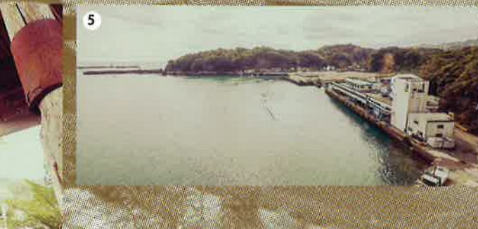
①豊漁を祈願する「熊野神社」の神事にあわせ、甲浦港をパレードする御輿船。②軒を連ねる家の脇の細い路地。③学校通りの小学生。④毎朝この道を通って学校へ通い、毎夕この道を通って家に帰る。⑤港町を歩いて見えてくる、小さく細い階段。そこを上ると、例年10月に「トントコ祭り」が行われている熊野神社が。⑥甲浦港から見た甲浦の町並み。この町並みは、古き良き日本らしさがたくさん残っている。