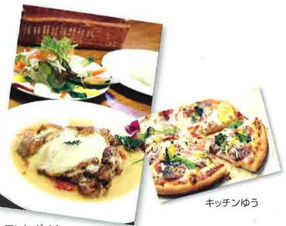
アント・ダイナ キッチンゆう