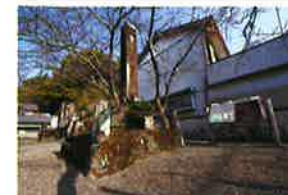
えとうしんぺい そうやくのひ