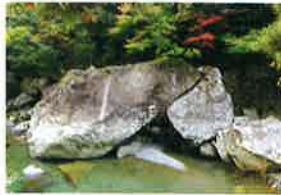
うしがいし うまがいし