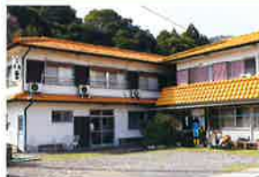
みんしゆく たにくち