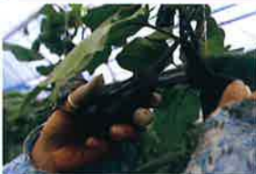
くまがい ファーム