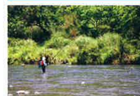
のねがわの あつり