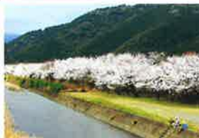
のねがわ さくらなみき