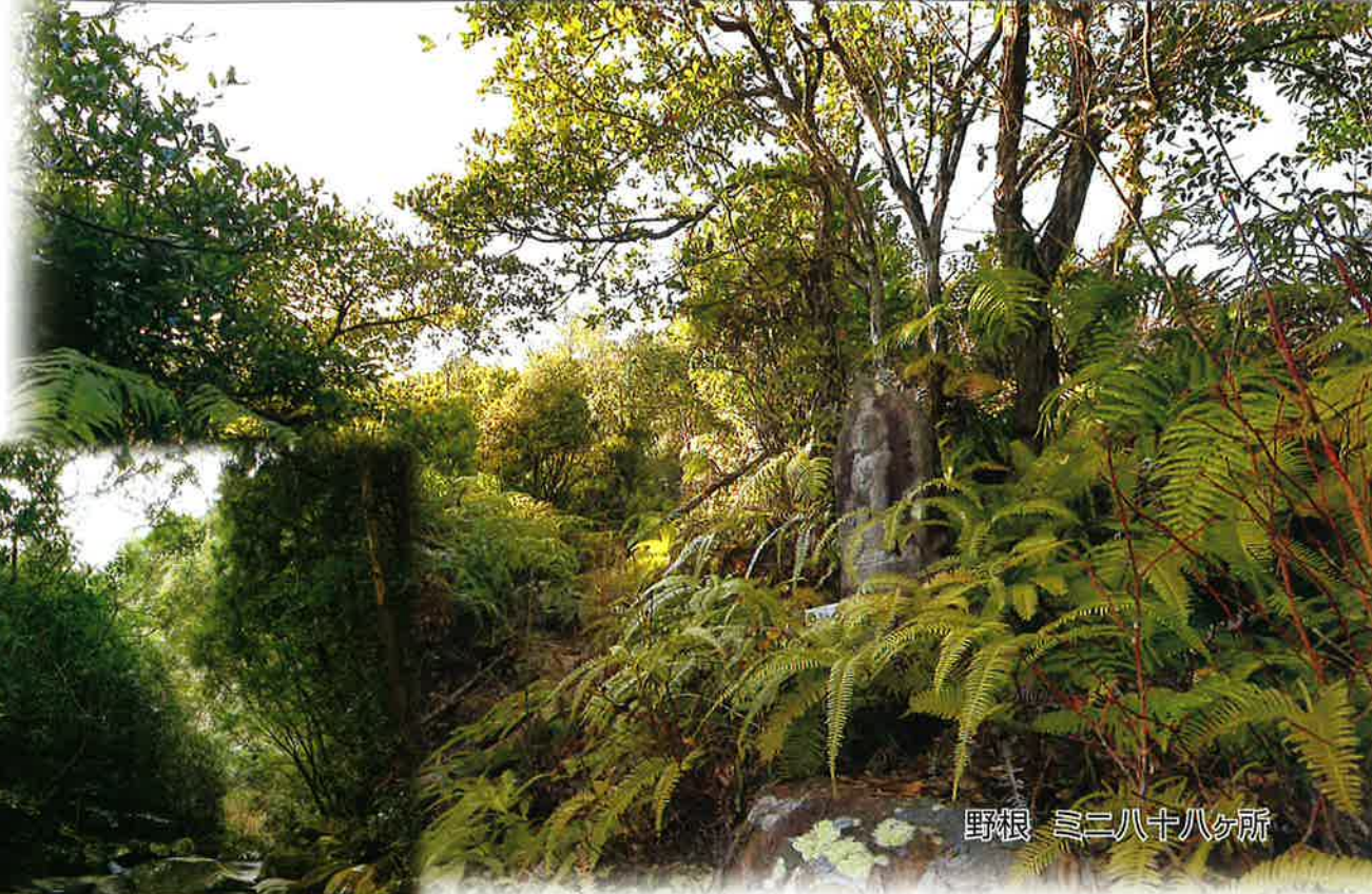
野根 三二八十八ヶ所