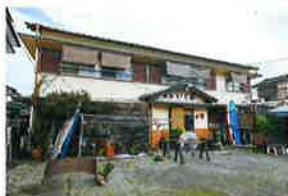
みんしゆく いくみ