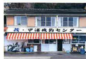
かんのうら いそづり センター