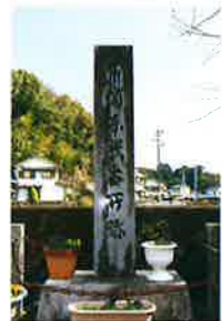
ひがしまた ばんしょあと