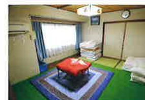
みんしゆく なかお