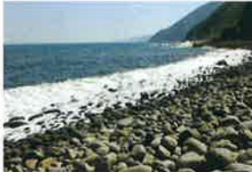
ゴロゴロ かいがん