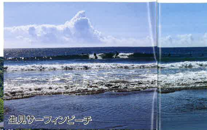
生見サーフィンビーチ