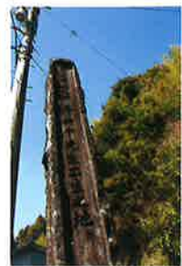
たにじちゅう せいたんのみ