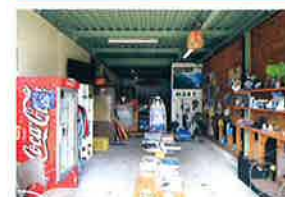
サーフショップ モア