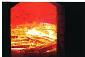
とさびんちようたん せいさんしゃ くみあい