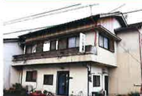
みんしゆく なんごくえん