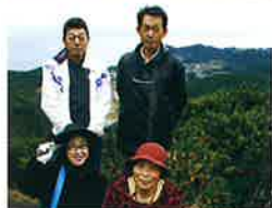
かんのうらの かじゆなかま