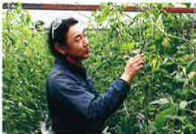
いくみ オーガニック トマトファーム