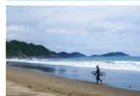
いくみ サーフィンビーチ