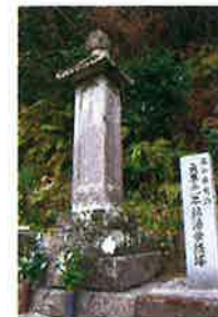
まんぶくじ きやうとう