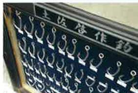
こまつけいさく しょうかい