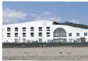
いくみ ホワイトビーチ ホテル