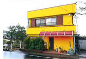
みんしゆく サーフ ポイント