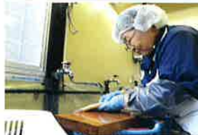
かぶしき がいしゃ マルキョウ