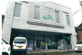
JAこうちけん とうようししょ