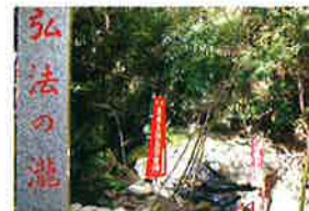
めいとくじの たき