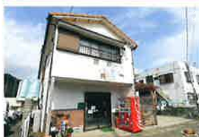
みんしゆく みなみかぜ