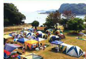
しらはま キャンプじょう