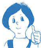
sekiyumi 高知県出身アーティスト

高知県生まれの雑貨デザイナー。マボロシ君を連れて高知県内全域を行脚中。今回はマボロシ君に誘われるがまま東洋町を初訪問ながら、すでにこの町が大のお気に入り。sekiyumi.com