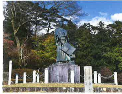
野中兼山像(帰全山公園内)

江戸時代から続く奉納相撲で、本山町の無形文化財に指定されています。毎年8月14日に開催され、子どもから大人まで迫力ある取り組みが行われます。