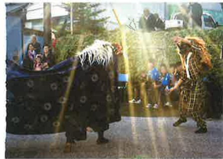
十二所神社：上／大祭：下