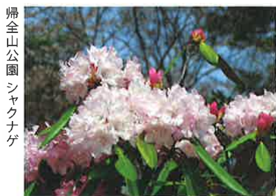
帰全山公園 シャクナゲ