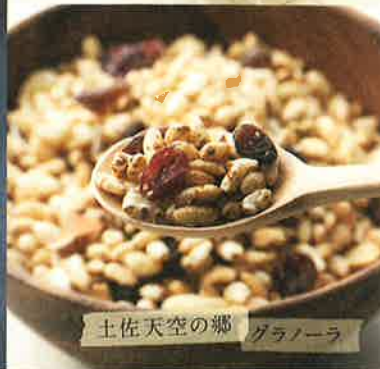
土佐天空の郷 グラノーラ