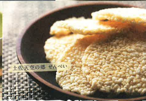
土佐天空の郷 せんべい