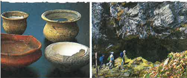
松ノ木遺跡の出土品

まちの中央を吉野川が蛇行する本山町。川の流域には河岸段丘が発達しており、古くから人々はそこで田を耕し、豊かに暮らしていたと見られています。松ノ木遺跡は、四国最古の穀物「シコクビエ」が発見された西日本屈指の縄文遺跡で、縄文時代の土器が出土しています。町内には上奈路遺跡、永田遺跡、銀杏ノ木遺跡もあり、縄文時代・弥生時代に栄えた集落の跡を残しています。