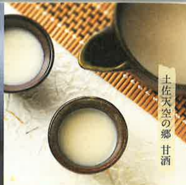
土佐天空の郷 甘酒