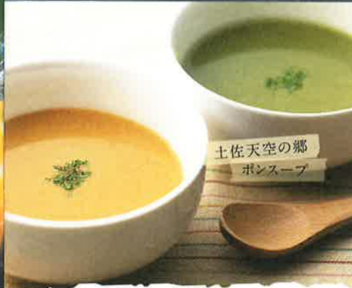
土佐天空の郷 ポンスープ