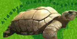
Aldabra Giant Tortoise