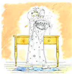
作・絵/児島なおみ 偕成社 2005年