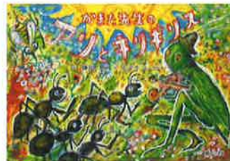
作/鎌田寛 絵/スズキコージ 童心社 2018年