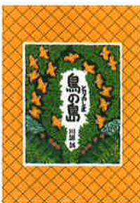
作/川端誠 BL出版 1997年