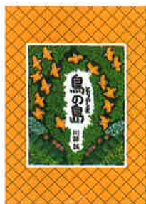
作/川端誠 BL出版 1997年