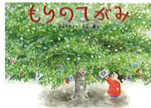
作/片山健 絵/片山健 福音館 2006年

つるして返事を待ちました。相手を想って書く手紙と、返事を待っている間のどきどきした気持ち。お手紙って、いいものですね。