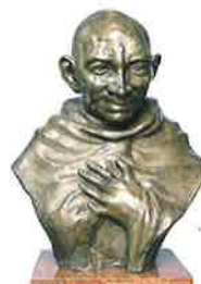
高田博厚(ガンジー)1966年