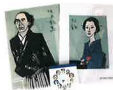
ミュージアムショップでは当館オリジナル商品もお買い求めいただけます。