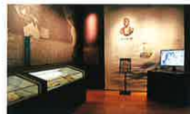
ジョン万次郎展示室

漂流後アメリカ捕鯨船員となり、西洋文化や英語を体得し、自力で帰国したジョン万次郎に関する資料を展示しています。