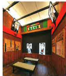
アニメーションで西郷隆盛と桂小五郎が対談する「薩長同盟」(幕末広場)