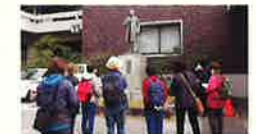
◀昨年のウォーキングイベント

龍馬の誕生日、そして当館の開館記念日である11月15日を無料開館日とします。どなたも無料でご入館いただけます。