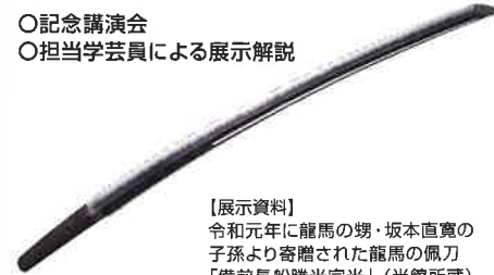
【展示資料】令和元年に龍馬の甥・坂本直寛の子孫より寄贈された龍馬の佩刀「備前長船勝光宗光」(当館所蔵)